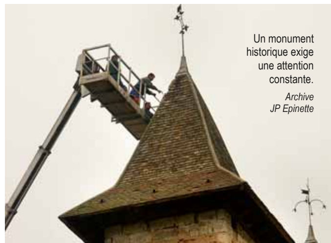
Un monument historique exige une attention constante.

tic de l'éclairage. L'objectif est d'avoir une vue complète des travaux qui devront être réalisés, sur plusieurs années, avec des recommandations sur leur programmation. L'étude sera réalisée courant 2019.